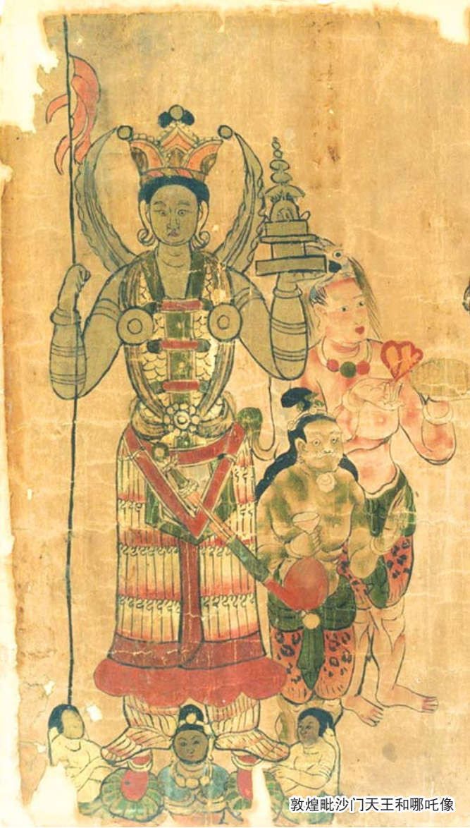
敦煌毗沙门天王和哪吒像