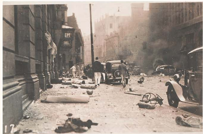
被轰炸后的城市街道。