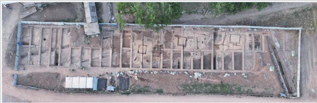
山东省文物考古研究院近日发布临沂市河东区毛官庄遗址考古发掘成果，该成果在沂沭河流域发掘确认的第一座龙山文化早期城址，距今约4300年。

提升服务质量，在保障游客“敢消费”上求实效。服务再优化。推进“旅游服务质量提升三年行动”，完善服务设施，提升入境旅游便利度，把“好客服务”标准践行好、推行开。监管再加强。严厉打击不合理低价游、强制购物、有偿代约、恶意抢票等行为，维护消费者合法权益。环境再提升。常态化推进文旅企业信用分级分类监管，包容审慎管理新业态，维护市场良好秩序。