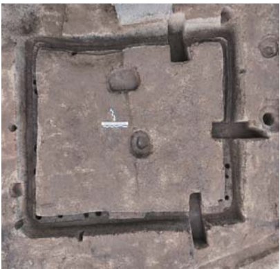
临沂市河东区毛官庄遗址一处房址俯瞰。