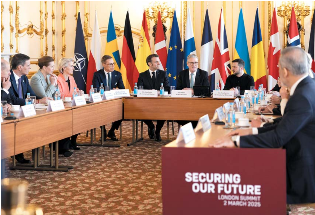
这是3月2日在英国首都伦敦拍摄的峰会现场。

斯塔默表示,与会各国同意英国、法国和其他国家与乌克兰合作制订一项停战计划,并将与