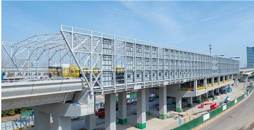
济南地铁8号线高架站外观。

近日，齐鲁晚报·齐鲁壹点记者走进济南轨道交通8号线施工现场，目之所及皆是热火朝天的建设场景。作为连接济南主城区与章丘区的重要交通动脉，地铁8号线一期工程自2022年9月开工以来，以“济南速度”不断刷新建设纪录。不仅建得快，8号线的“绿色”和“科技”范儿也成为一道道亮丽风景线。