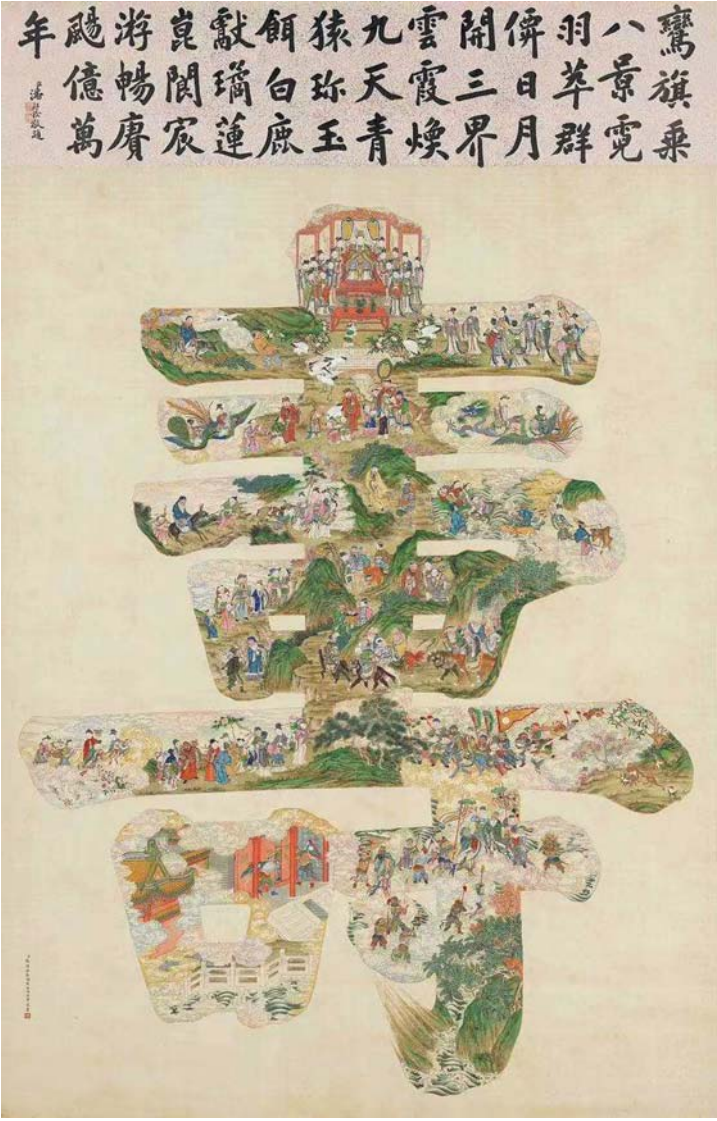
清代张恺梁德润张维明合绘的《群仙祝寿图》

憾没有伴她成长：“五逢晬日今方见，置尔怀中自惘然。”作为弥补，他在孩子的生日思考起教育问题，今后是给她针线、琴棋，还是蔡邕留与女儿蔡文姬的书籍？他把这些感触，都写在《少女生日感怀》诗中。