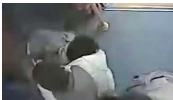
▲宫健在公交车上留下的背影。