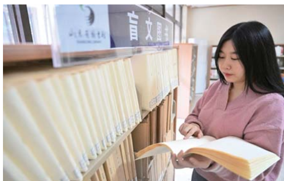
▲不打印的时候她喜欢沉浸在盲文书籍里。