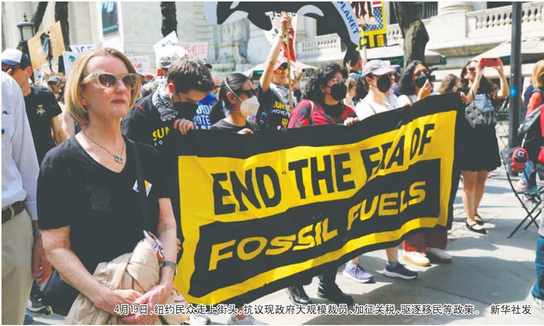
4月19日,纽约民众走上街头,抗议现政府大规模裁员、加征关税、驱逐移民等政策。

美国总统特朗普第二届任期将满百日之际,美国民调结果显示,他的执政百日支持率在80年来美国历任总统中垫底。据美国法律研究机构统计,特朗普政府面临的诉讼已达200余起。美联社评论说,特朗普执政百日的特点是“碾轧”美国政府、“胁迫”盟友、发动关税战。