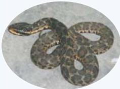
蝮蛇 (短尾蝮):分布最广，多见于山区、草丛。