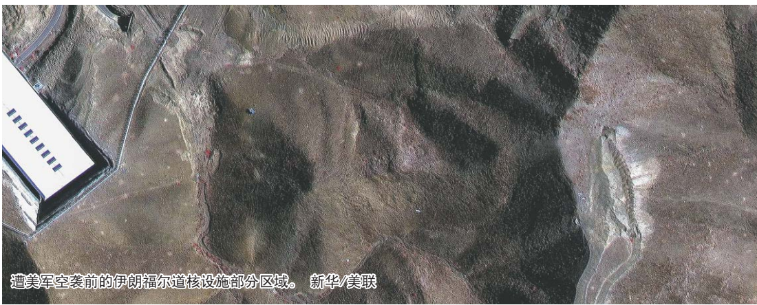
遭美军空袭前的伊朗福尔道核设施部分区域。

美国总统特朗普当地时间22日在社交媒体上发文用“毁灭性”形容美军对伊朗福尔道、纳坦兹和伊斯法罕三处核设施的“成功打击”。美国白宫表示，特朗普将于23日和其国家安全团队评估此次对伊打击的成效。代表伊朗库姆省的议员莱希说，福尔道核设施并未受到严重破坏。伊朗此次遭受的三处关键核设施受损情况究竟如何？各方各执一词。