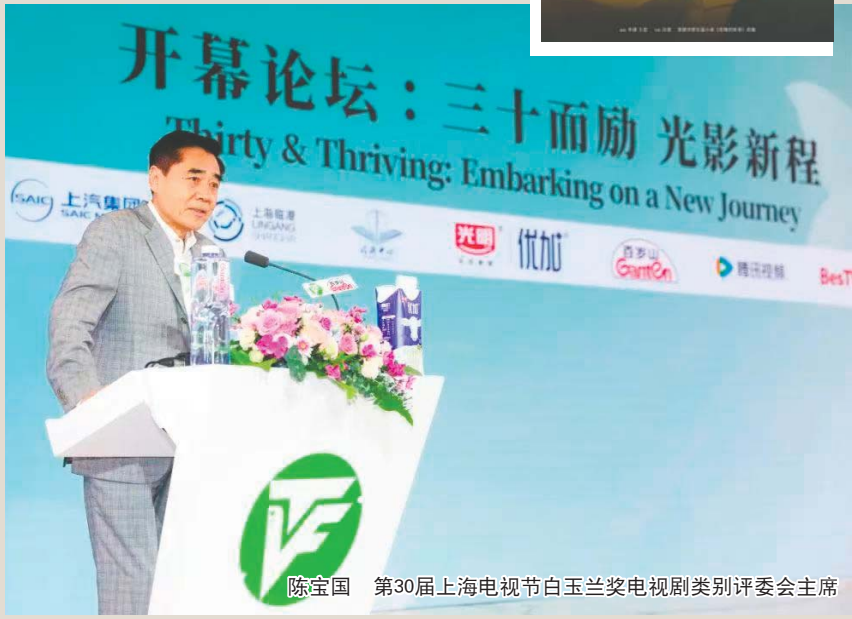
陈宝国 第30届上海电视节白玉兰奖电视剧类别评委会主席