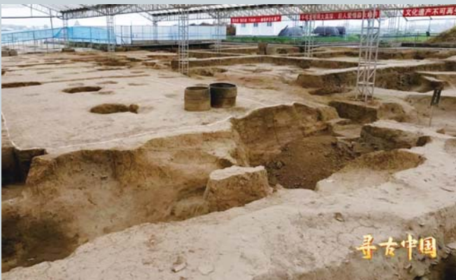
淄博临淄齐国故城稷下学宫遗址