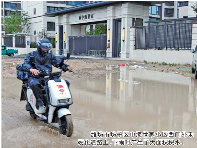
潍坊市坊子区中海世家小区西门外未硬化道路上,下雨时产生了大面积积水。

路何时能真成“路”?针对中海世家小区居民雨天出行难的问题,记者联系到了坊子区住建局。一位王姓的工作人员说,目前中海世家北门及西门道路均暂未列入修建计划,而关于中海世家居民雨天出行困难的问题,王姓工作人员表示会继续推动解决。