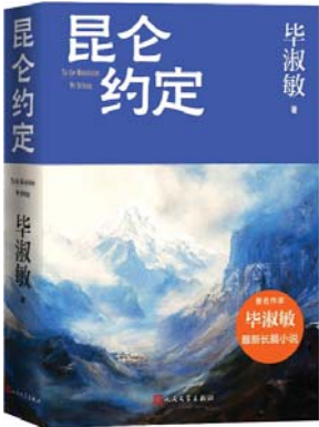
《昆仑约定》 毕淑敏 著 人民文学出版社

小说以上世纪六七十年代的高原戍边生活为背景，讲述了一群年轻战士在极端环境中淬炼生命、追寻理想的故事。