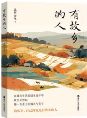
《有故乡的人》 钱解金龟 著 浙江人民出版社

这是一本关于“乡愁”的文集，作者在书中表达了自己对家乡的怀念，同时对盛行的“怀乡病”进行了思考和解读。