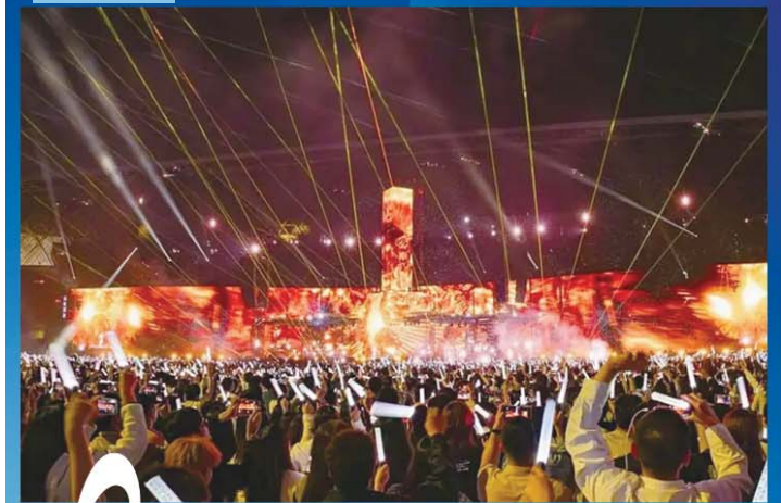
几乎每场演唱会，都能引发全城狂欢。