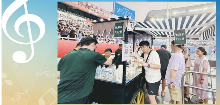
相关部门对演唱会全力做好后勤保障。

诗人，其“此站麻园”巡回演唱会收官场，也将于8月23日在济南唱响……丰富的阵容，让不同圈层的乐迷，都能在济南找到共鸣。