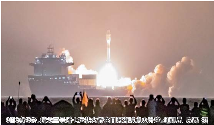
9日3点48分，捷龙三号遥七运载火箭在日照海域点火升空。通讯员 东磊 摄

优化流程后，两次发射之间的准备时间变得更短。“一次多发”“一周多发”的既定目标正逐渐接近。如今，“一月多发”的小目标已经实现。