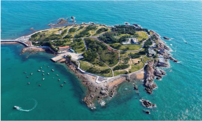
小麦岛犹如一块翡翠嵌在蔚蓝的黄海里，美不胜收。