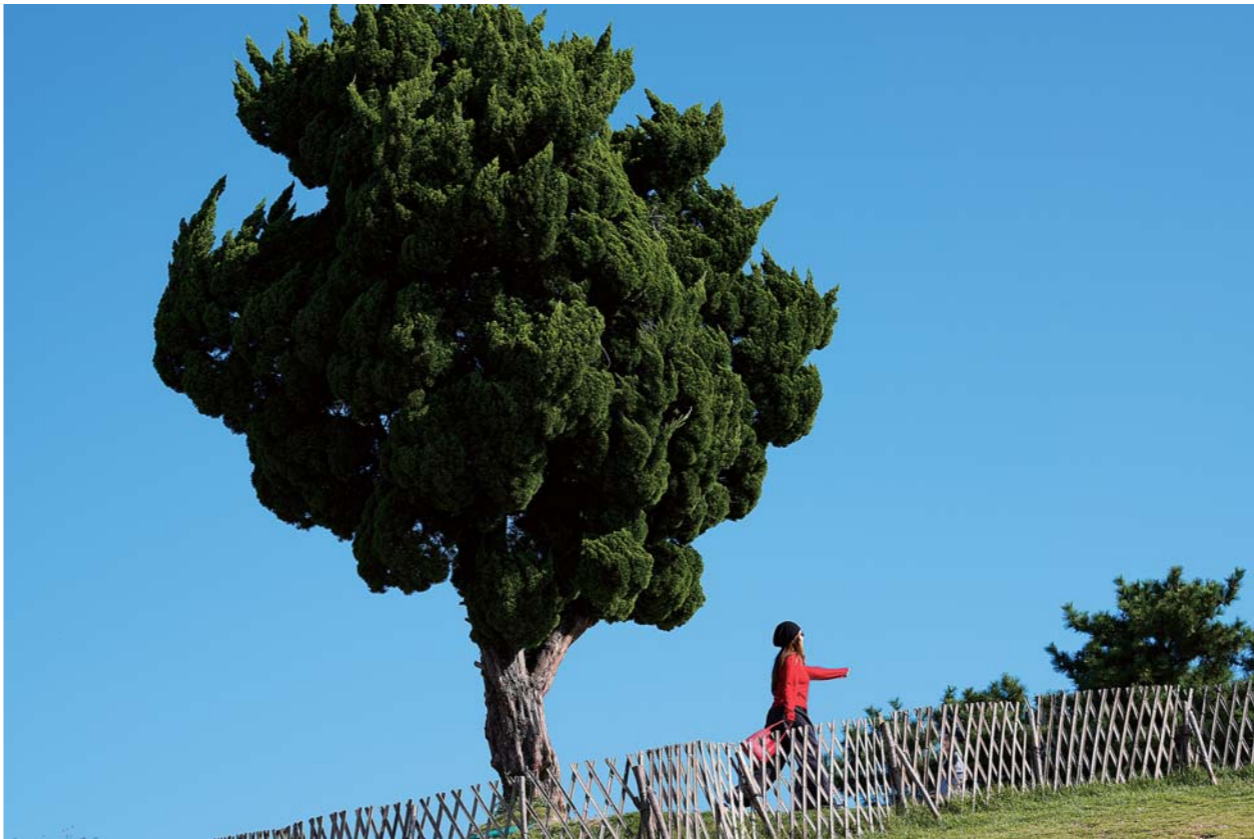
“孤独的树”不孤单，小麦岛“海景c位”拍照人流不断。