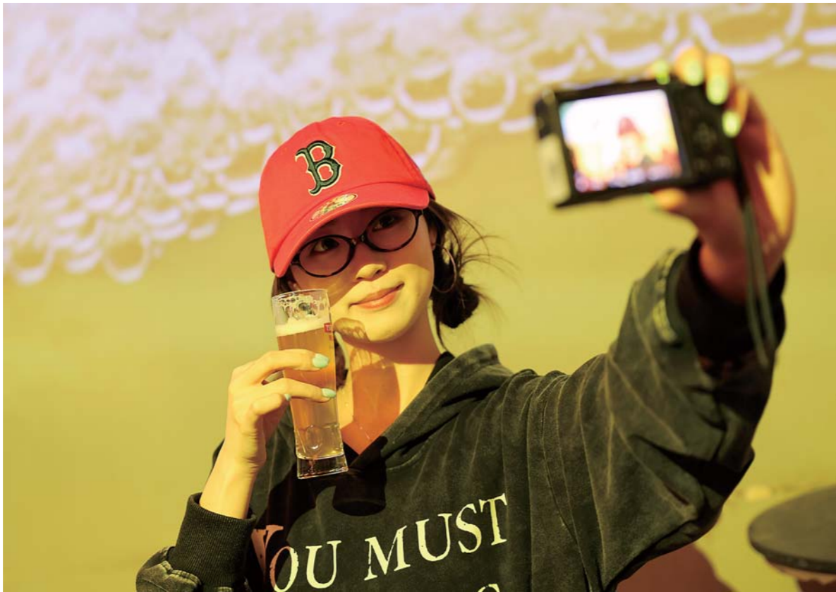
在青岛啤酒博物馆，举杯自拍，金黄泡沫入镜，人与啤酒一起定格“醉”美瞬间。