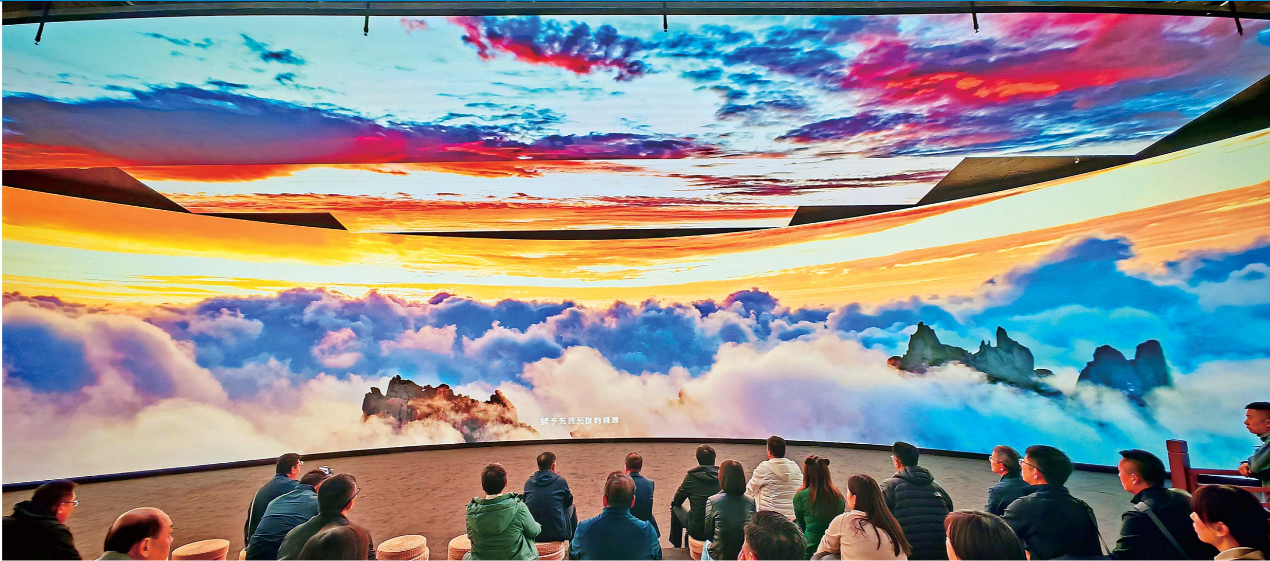
借助多媒体交互技术和VR科技突破次元，穿越时空，在沉浸式视听体验中领略“大道崂山”的震撼。