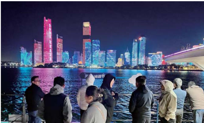
乘船夜游浮山湾，感受岛城璀璨夜景。