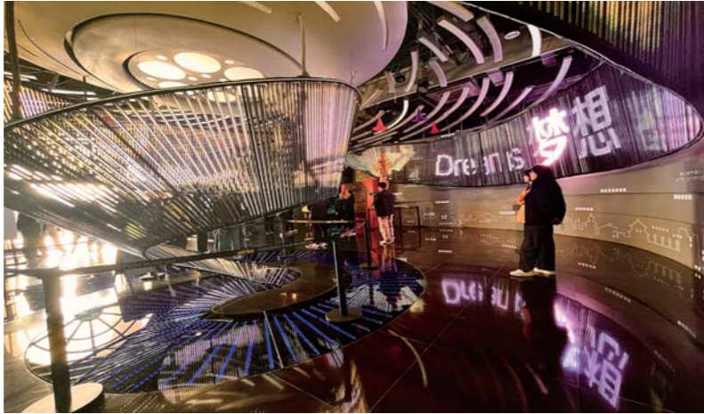
东方影都电影博物馆，光影为翼，托举每一个电影梦。