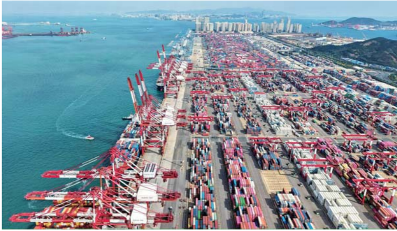
青岛港全自动化集装箱码头不见传统码头的人声鼎沸。