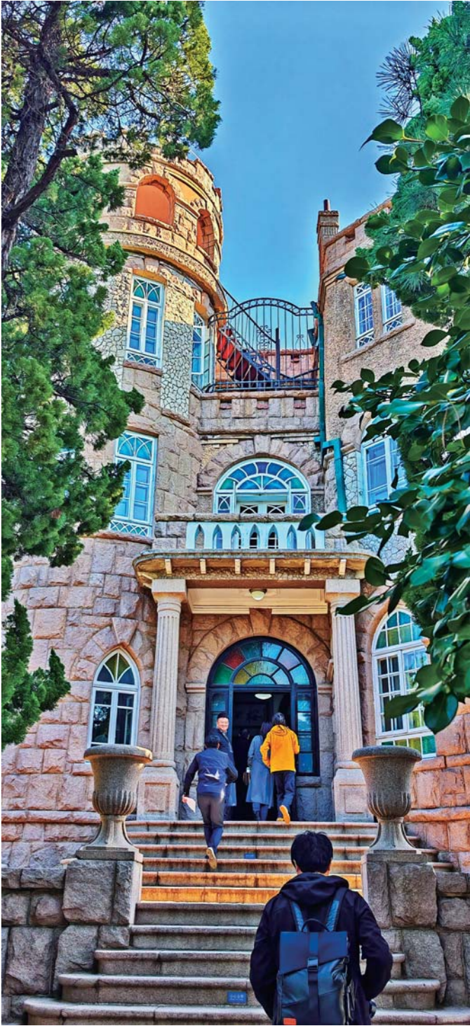
花石楼融合了哥特式尖顶、罗马柱廊与中国传统花格窗，被誉为“海上古堡”。