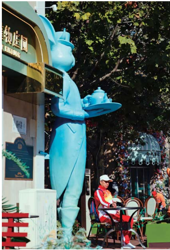
游客在大鲍岛文化休闲街区沐浴阳光，老城慢节奏悄然上线。

从“网红墙”到小麦岛，从街角小店到老里院，青岛把“城市像素”拆成无数可传播、可参与、可二次创作的“流量接口”，让山海之美与都市烟火一起，成为火爆背后的“流量密码”。