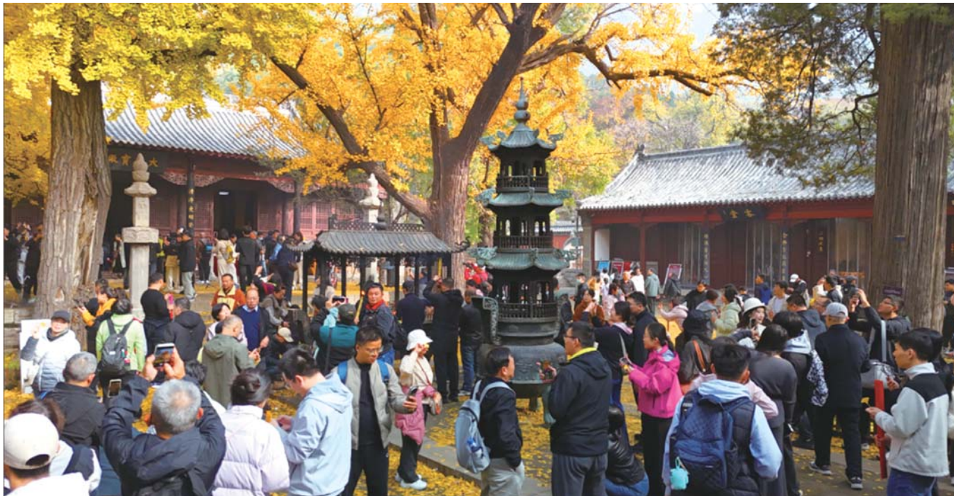
济南灵岩寺景区成为秋游济南的“人气打卡地”。

大红叶观赏推荐地之一，拥有一侧火红一侧翠绿“鸳鸯锅”美景的蝎子山近日游客爆满。而满树金黄宛如身披金甲的淌豆寺千年银杏、如诗如画的自然秘境龙洞风景区、拥有绝美秋景和特色酒店的九如山等也都来到了最佳观赏期，均成为济南赏秋“顶流”目的地。