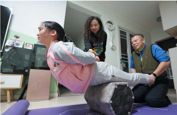
父母全力支持，陪她一路把柔道练到现在。