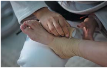
柔道场上，缠了绷带也只是把伤固定好，还要接着练。