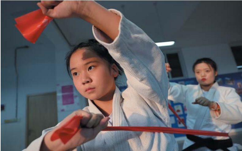
训练前的热身毫不含糊。