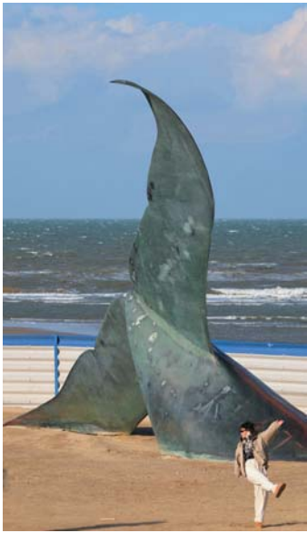
烟台孤独的鲸在冬季也吸引了不少游客拍照留念，为海滨增添别样的冬日浪漫。