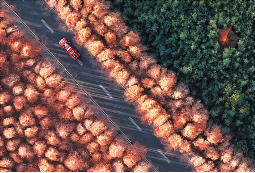
▼日照海滨国家森林公园的水杉林被夕阳映照出暖色的光影。