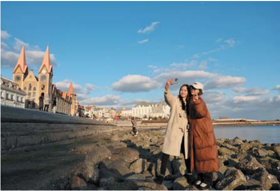
▲冬日的烟台月亮湾，潮涌澎湃，海鸥翩跹，尽显滨海冬韵。