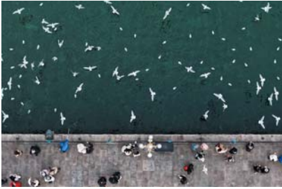
◀冬日到青岛，与海鸥共舞，邂逅一场浪漫的海滨之约。