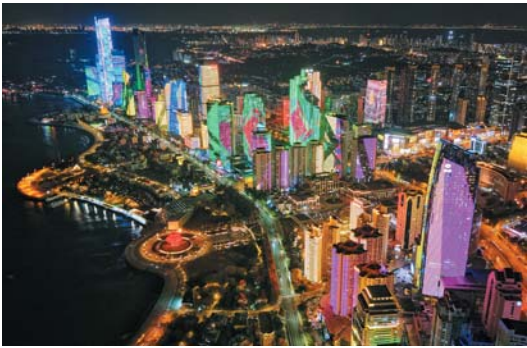
夜幕降临，青岛浮山湾的灯光秀盛大开启，光影交错间，海面与建筑交相辉映，如梦似幻。