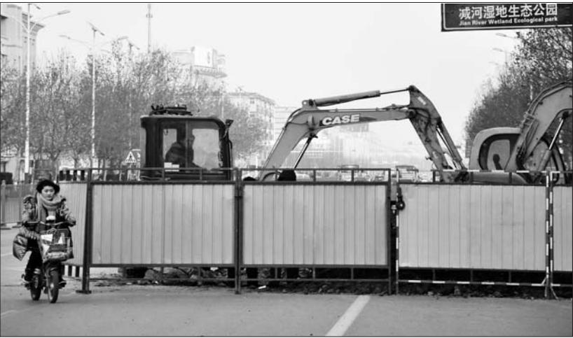
在德州东风路自来水管道路抢修现场,施工人员正在抓紧时间维修。

记者随后联系上德州市供水总公司,工作人员告诉记者,第一干休所的居民9日将此事反映给他们后,工作人员就到现场对供水管道进行初步检查,供水管道未有破裂现象,通过仪器测试发现,通往小区