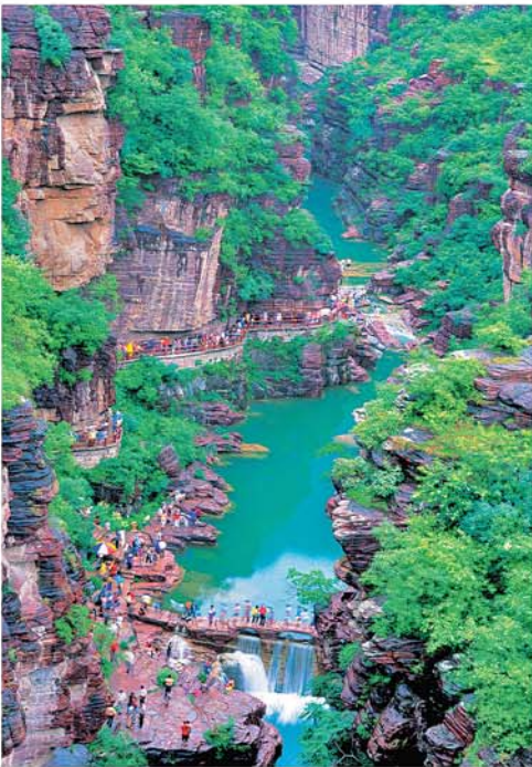
云台山享誉海内外

以其淡雅自然、肌润如脂彰显独特和名贵；仿制唐三彩的工艺日臻完美；甲骨文篆刻已经成为中国书法的品牌。