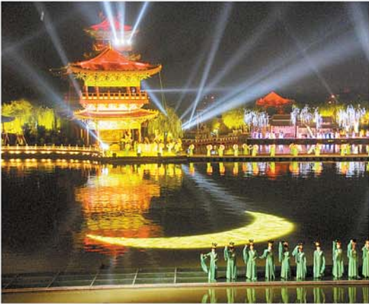
华美的清明上河园

四是山水之旅。这条线路主要分布在伏牛山、太行山、王屋山、桐柏山—大别山，涵盖了我省山水旅游景区的精华，是最具河南代表性、最具游客人气、最具养生价值的线路。在这里，可以领略春的生机、夏的热情、秋的爽朗、冬的静谧，充分体验精致华丽、色彩斑斓的河南，是一年四季均值得推广的河南旅游精华之选。