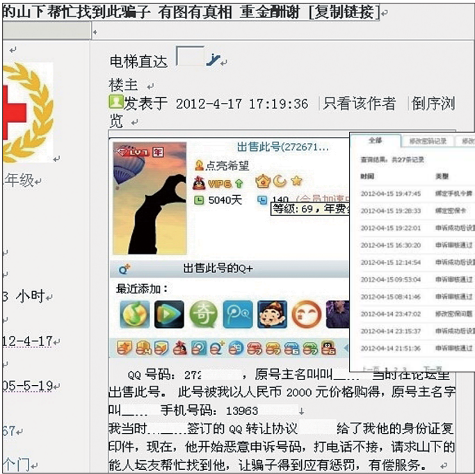
▲高先生在烟台某论坛发求助帖的截图。