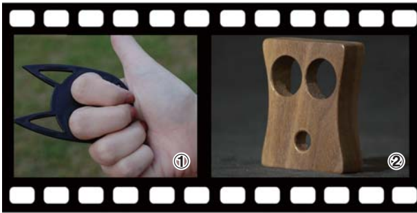
上期答案：1.牛角开瓶器 2.按摩花洒

《联合早报》的报道称，一项调查显示，办公室电脑鼠标的细菌含量是厕所马桶坐垫的3倍。调查还发现，男性使用的鼠标，其细菌含量比女性多40%；而办公室第二脏的物品是键盘，接着是电话和椅子。