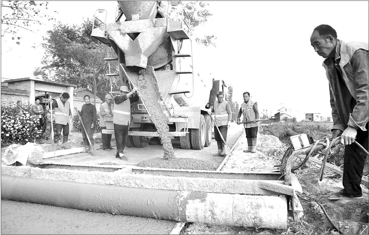
►金乡县化雨镇冯海村在修筑进村道路。(资料片)

本报济宁8月15日讯(记者刘守善 通讯员 马鲲鹏 陈颖清) 15日,济宁市召开农村环境综合整治工作动员大会。5年内,全市所有村居实现硬化、净化和美化。至2015年底,全市所有村庄完成道路硬化。到2016年,各乡镇按照规划完成垃圾转运站建设,村庄主次干道实现绿化、美化。 近来,围绕“村容整洁”的目标,济宁市开展了村庄环境整治,村容村貌有了明显改观。但是部