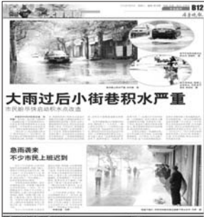
本报关于积水点的报道。

本报济宁8月15日讯(记者刘守善) 15日,济宁城区积水点改造工程在济宁市公共资源交易中心开标,此次开标的工程为英华路南段及车站东路(火车站东北角)两大积水点。英华路南段和车站东路积水点改造工程即将开工。 与以往多数建设工程招标投标不同的是,此次积水点改造采用竞争性谈判方式进行公开招标,竞争性谈判的方式最大的好处是节省时间,从招标开始到开标确定施工队伍只需7个工作日。 确定施工队伍后,两处积水点改造将尽快开工。招标文件中指出,施工方必须具备独立法人资格,且具备市政公用工程施工总承包贰级及以上资质,并在人员、设备、资金等方面具有相应的施工能力。同时,项目负责人必须为本单位注册的市政公用工程专业贰级及以上注册建造师且不得有在建工程(含已中标的待建工程)。