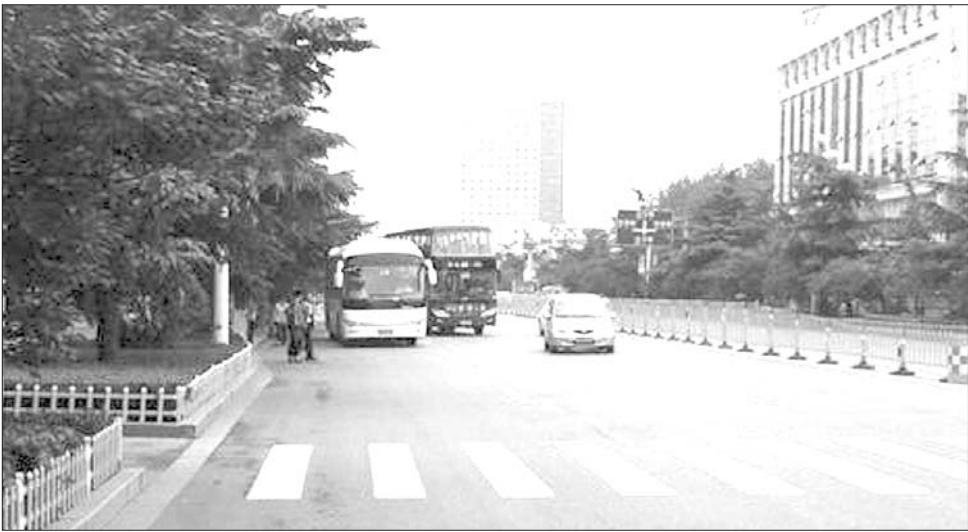
►一辆公交车被一大巴班车占了地盘。

本报济宁8月15日讯(记者 汪洸 通讯员 朱珊珊) 每天乘公交车上下班的市民时常在公交站牌前看到这样一幕，公交车即将进站的时候，却被一些企业班车、私家车抢占“先机”，停在公交站牌前随意上下人。而等候公交的市民要么在站台前继续等待公交进站，要么疾走两步蹿到机动车道上挤公交，造成市民很不方便，也令公交司机十分为难。 15日上午8时，在洸河路邮电新苑小区的公交站前，记者看到一辆大巴班车停在那里上下人，而一辆33路双层巴士，一辆21路公交，则只好被堵在后面无法进站，很多正在等候公交车的市民，只好匆忙跑到机动车道上挤公交。而等公交准备起步的时候，班车仍没有动静，33路公交只好向左超车，很多从后面驶来的汽车也要么减速，要么变道。