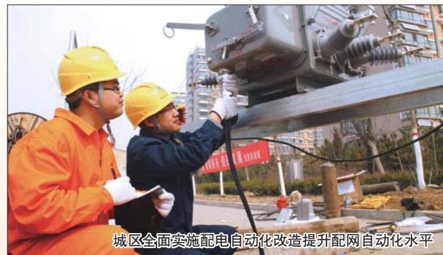
城区全面实施配电自动化改造提升配网自动化水平

示,他们将始终保持“敏锐、敏感、敏捷”的精神状态,大力发扬“准、快、韧、实”的工作作风,稳步推进“三集五大”体系和坚强智能电网建设,持续推进居民用电服务质量全面提升。(鞠同心 孙琦)