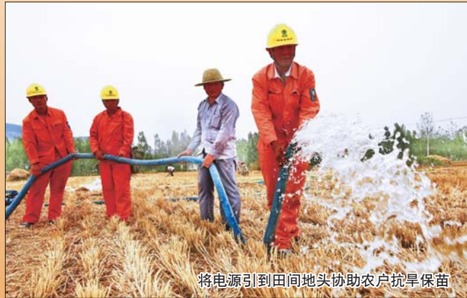
将电源引到田间地头协助农户抗旱保苗