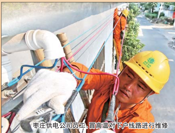
枣庄供电公司员工,冒高温对下户线路进行维修