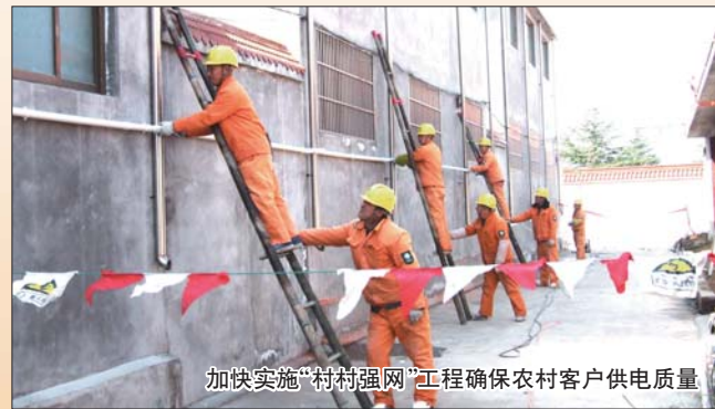
加快实施“村村强网”工程确保农村客户供电质量