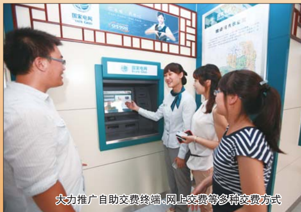
大力推广自助交费终端、网上交费等多种交费方式