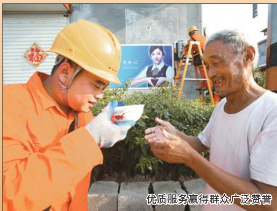
优质服务赢得群众广泛赞誉