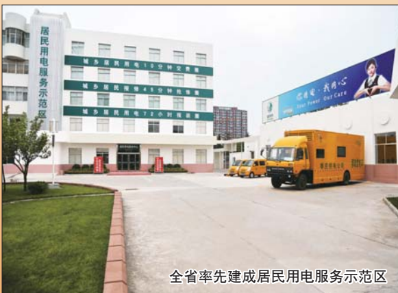
全省率先建成居民用电服务示范区