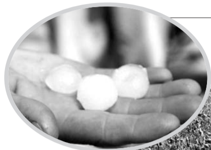
▲未融化完的冰雹。