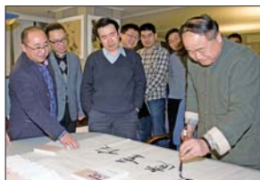
▲莫言为本报挥毫题词。（资料片） 本报记者 郭建政 摄