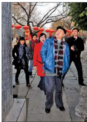
▲来本报做客之余，莫言游览趵突泉。（资料片）