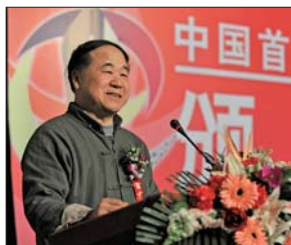
▲今年年初，莫言出任本报主办的“中国首届网络文学大奖赛”颁奖嘉宾，并发表演讲。（资料片）