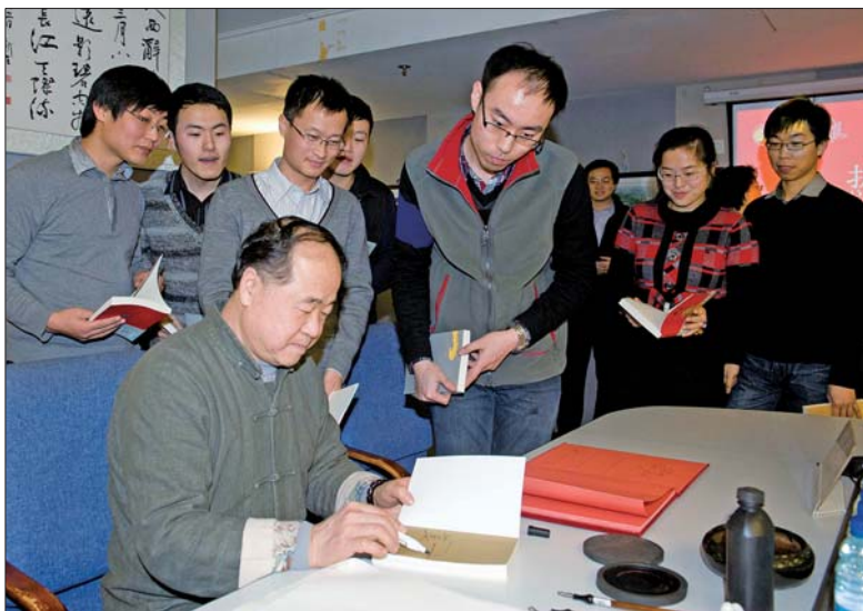
1月7日，莫言做客本报编辑部，并为爱好其作品的编辑记者签名。（资料片）

离开编辑部前，莫言还为齐鲁晚报题词留念，挥毫写下“任重道远”四字，勉励本报再接再厉继续为读者奉献精品。在第二天的网络文学大奖赛颁奖典礼上，莫言发表了长达一个半小时的精彩主题演讲。对于齐鲁晚报多年来为中国文学做出的贡献，莫言也给予了充分肯定。（本报记者）