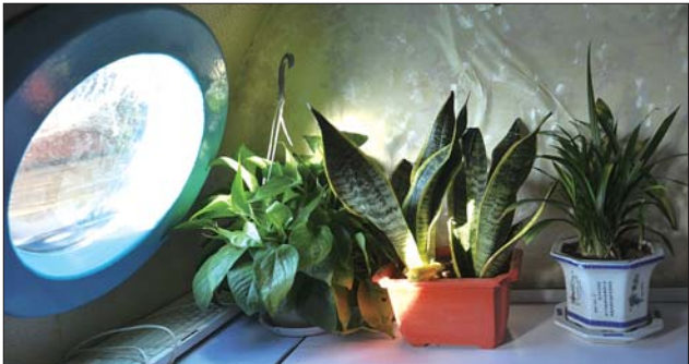
▲“潜水艇”舱内,生机盎然。