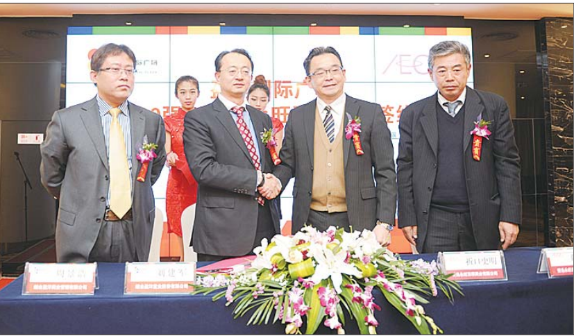
盈沣·国际广场与永旺签约仪式现场。