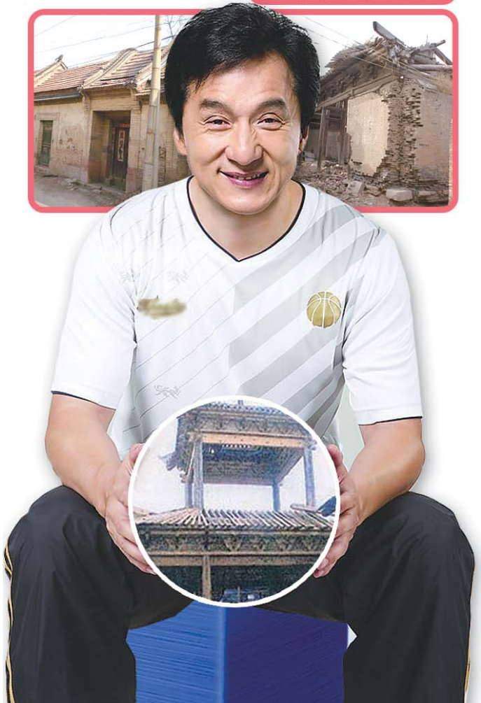
成龙捐赠古建筑引起争议。图为我省部分古建筑现状。