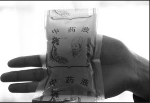
滨州城区一家药店出售的预防禽流感中药液。