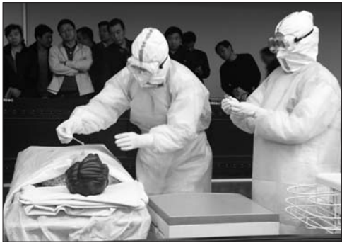
医护人员正在对模拟患者进行诊治。

本报4月16日讯(记者 张牟幸子 通讯员 王丹) 16日下午,由滨州市卫生局组织的全市人感染H7N9禽流感救治培训在滨州市人民医院举行,市疾控中心主要负责人员及各县区卫生系统工作人员全部参加。培训会上还进行了H7N9禽流感救治演练。