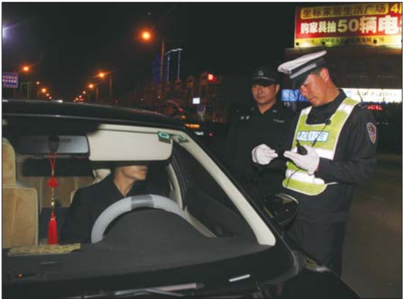
▲查酒驾已成为全市交警部门时刻进行的常态化工作。

费力,得不偿失。 2011年5月1日起,《中华人民共和国刑法修正案(八)》正式实施,醉酒驾驶将作为危险驾驶罪被追究驾驶人刑事责任,最高可处6个月拘役。