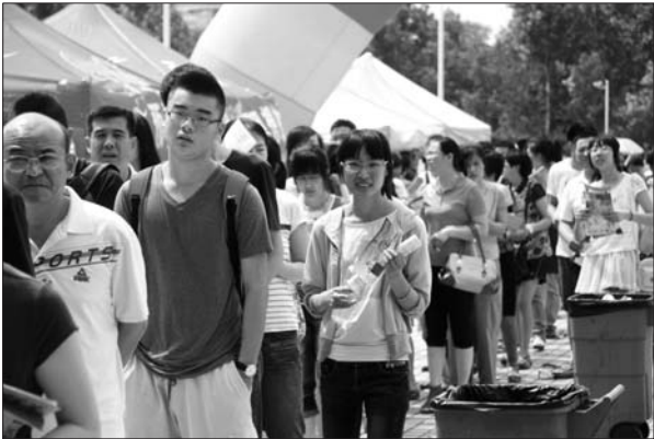
高招会入口处等待入场的学生和家長排起了长队。

“从早上到现在，两小时起码有两三百人过来咨询了，还有很多领了资料的”。潍坊科技学院的招生工作人员告诉记者，现在潍坊本土的高校都非常注重内涵发展，加上潍坊近几年发展迅速，就业环境也不错，赢得众多潍坊本地考生的青睐。 “高分本科生肯定还是会想出去上学，分数较低的以及专科生更多的还是会选择潍坊本地的院校”。潍坊职业学院的招生人员说，现在潍坊职业学院每年招收的新生中，潍坊本地考生能占到三成，比例算是比较高的。