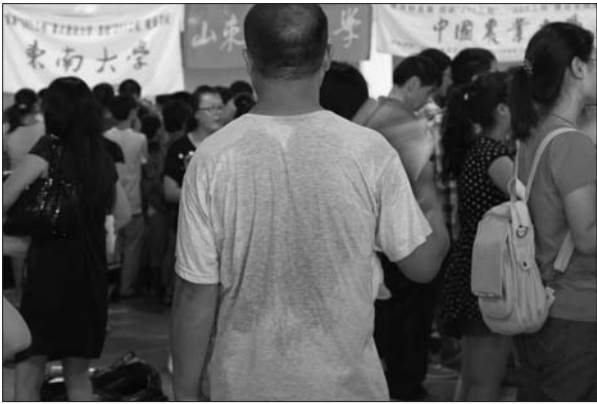
一位家長幫孩子諮詢熱得汗流浹背。