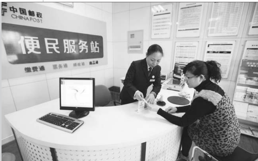
山东邮政便民服务站。