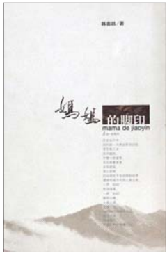
《妈妈的脚印》 韩喜凯 著 泰山出版社