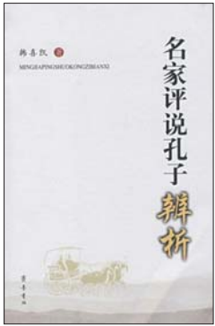
《名家评说孔子辨析》 韩喜凯 著 齐鲁书社