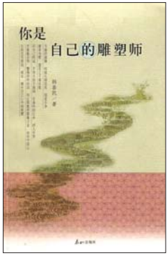
《你是自己的雕塑师》 韩喜凯 著 泰山出版社