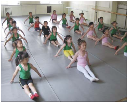
兴趣班里多数为4至6岁的儿童。

师要求小学员们在马杆上压腿。刚开始的时候她还能跟随着音乐有节奏地压起,但是几分钟过后,她就开始东张西望,然后就自己趴在杆上,呆呆地看着前面。老师过去帮她矫正姿势,她就任由老师摆弄。老师告诉记者,这个小女孩今年三岁多了,是两岁零十个月时开始跟着学习舞蹈的,已经学了有大半年了,自理能力不算很好,毕竟年龄小。由于年龄小,三岁娃动作标准性和反应性较其他小朋友有些弱,这也是三岁娃,没有好朋友的原因。