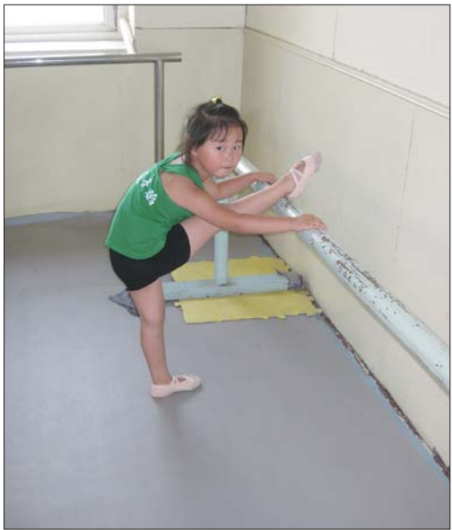
三岁娃正认真练习舞蹈基本功。