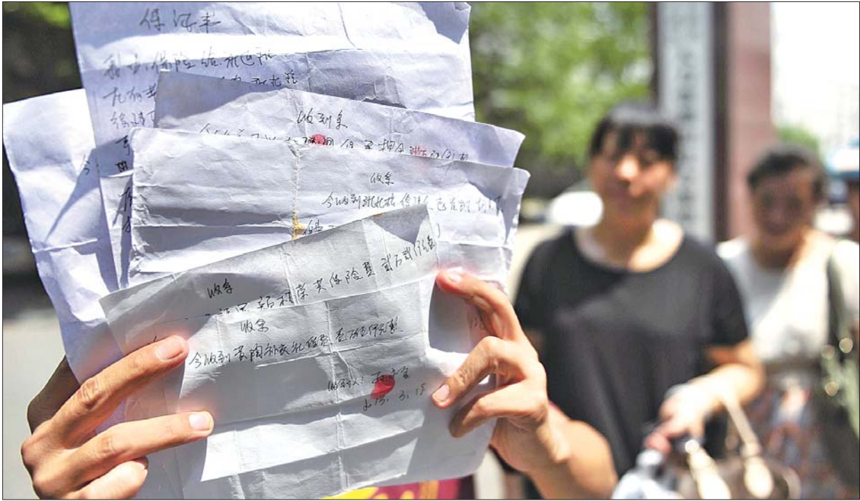
6日,在历城区人力资源和社会保障局门前,外地购房者们拿着当时交钱的收条。