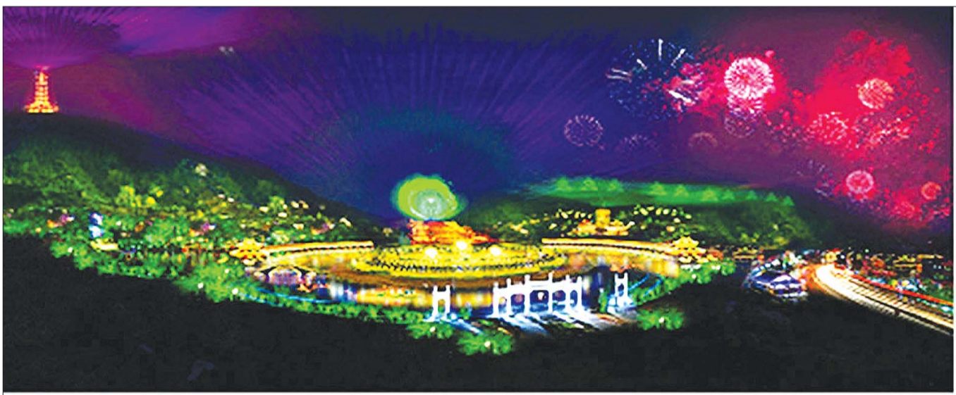
规划中,佛慧山东入口将建佛慧广场,举办大型实景演出。

今年是泉水持续喷涌十周年,泉城将迎来首个泉水节和天下第一泉5A级景区。记者获悉,由于受空间限制,“泉城秀宴”实景演出将搬到室内,在千佛山-龙洞风景名胜区内规划中,佛慧山东门将建设佛慧广场,未来首个大型室外实景演出或将在此落户。