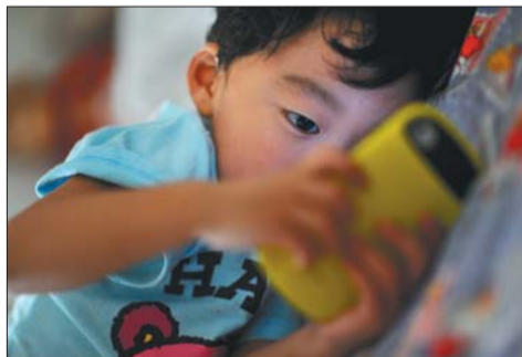
▲7月19日,星期五,玩妈妈手机里的游戏几乎成了儿子每天的“必修课”。