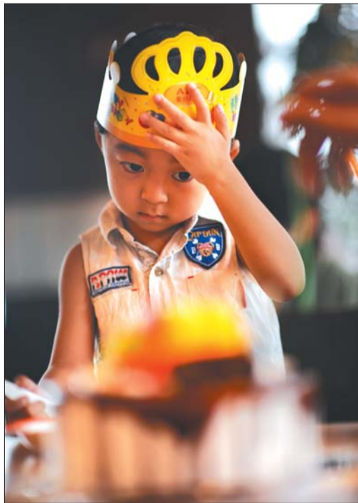
▲7月26日,星期五,看着生日蛋糕,儿子的眼神里掠过一丝忧郁。