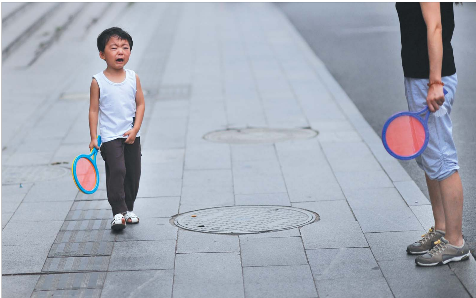
▲7月21日,星期日,想让妈妈抱着去操场打球的愿望没实现后委屈地大哭。