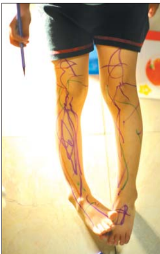
▲7月23日,星期二,儿子在自己腿上创作的人体彩绘作品颇有野兽派的风范。