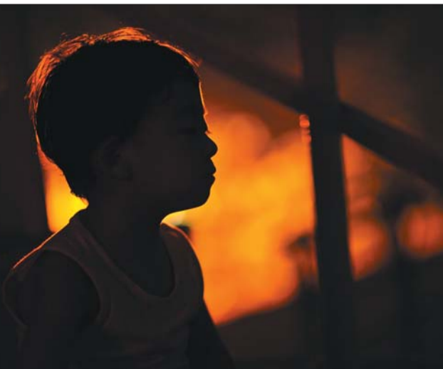
▲7月27日,星期六,走累了独自坐在台阶上闭目养神,远处是街角阑珊的路灯。