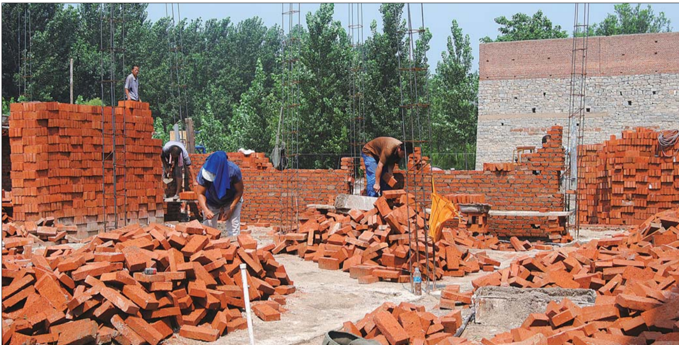
马山镇新敬老院建设工程启动,新敬老院全部建成后,将新增50个床位,大大改善全镇五保老人生活环境,全镇五保老人的集中供养率达到75%以上。 王秀凤 杨旭