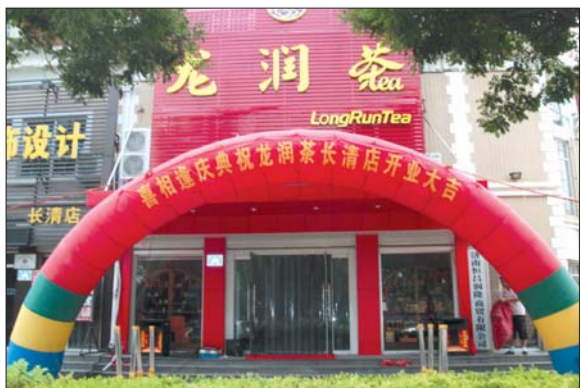
位于凤凰路的龙润茶专卖店于8月14日正式开业,长清区又多了一处中高档茶叶的销售点。