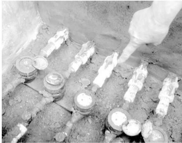
漏水的管道已经堵上。

15日下午,记者在樱花园小区见到了杨茂森夫妇,两位老人将近80岁了,女儿杨女士今天在家照顾他们。“两位老人能用多少水?家里还经常没人,不可能用这么多水。”杨女士说,12日抄表员到家里抄水表,打开井盖,看到连着进户水表的水管哗哗漏水,计量器上的数字达到1700多方。当时就找来管道维修工,换了个像螺丝帽一样的东西,水就不再向外流了。家里从来没有用过这么多水,抄水员三个月抄一次水表,平均每次用水四五方有十多块钱的水费。