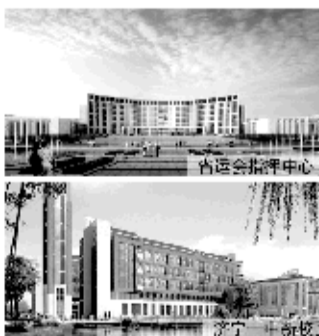
热销关键词:配套篇 星级物业、高端会所 带来尊贵生活享受

济宁六大名校所在区域汇集了济宁顶级的“一站式”教育配套资源。新规划的九年一贯制学校,集信息化、功能化、生态化于一体,与国际化的现代教育接轨;更有济宁市实验小学、山东理工大学附属等多所名校环绕周边,共同构筑了济宁市的教育核心,优质教育资源得天独厚。