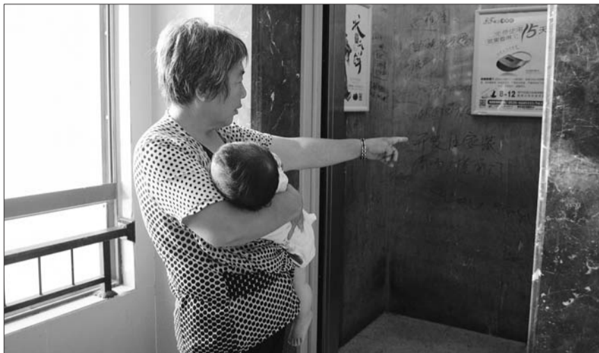
15日,说起小兄弟俩的遭遇,姥姥眼眶都是泪花,家里孩子多,她抱孩子下楼时很担心电梯出问题。

记者在小区里看到不少老人和小孩,小兄弟俩的遭遇很多人都已听说。16号楼的一位老人说,抱着孩子坐电梯时也有些担心。他们希望小区物业能够将电梯检查维修一遍,确保业主的安全。