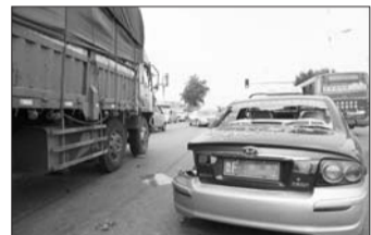
15日中午,被撞的出租车受损严重。

本报热线6610123消息(见习记者 张姗姗) 15日中午12点左右,芝罘区化工路只楚立交桥附近,一辆大货车遇红灯急刹,不慎撞上前面一辆出租车和一辆面包车。大货车轻微受损,被撞的两辆车却车身多处变形,所幸无人受伤。