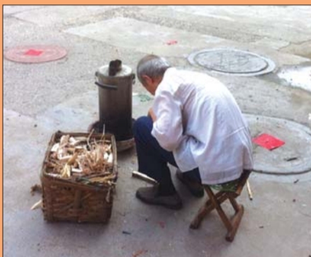
居民正在用柴火引炉子烧水。