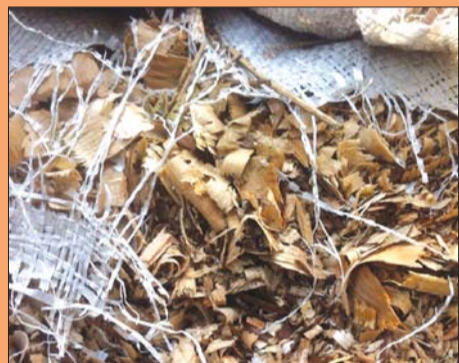
居民楼前一麻袋的木屑。