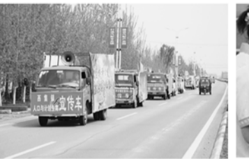
国策宣传车队巡回宣传