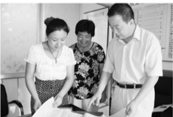
计生办主任在伏里村检查计划生育台账