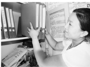
育龄妇女档案入库管理