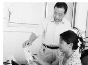
计生办主任了解流动人口管理情况