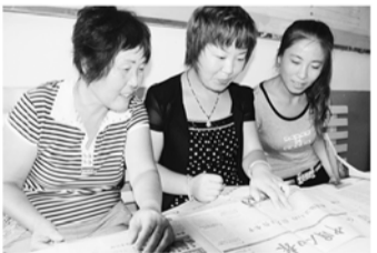
计生工作人员利用工作之余加强业务知识学习