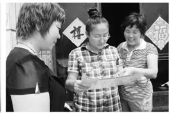
计生宣传进户到人