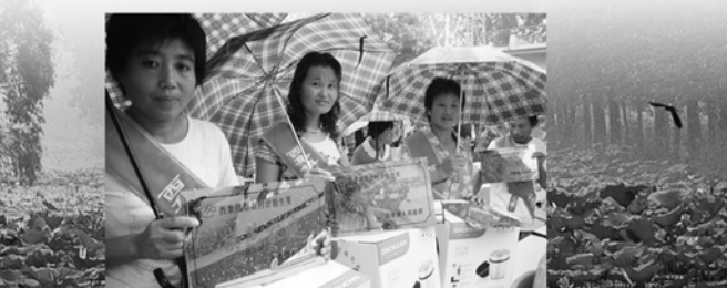
受表彰的计生模范家庭集体