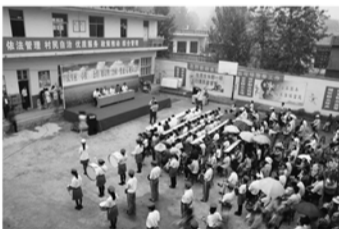
山亭区西集镇人口和计划生育工作异彩纷呈