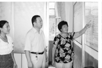
计生办主任听取村级计生工作汇报