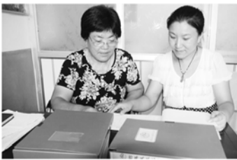
认真核对育龄妇女档案