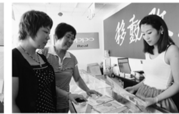
向流动人口宣传计划生育政策