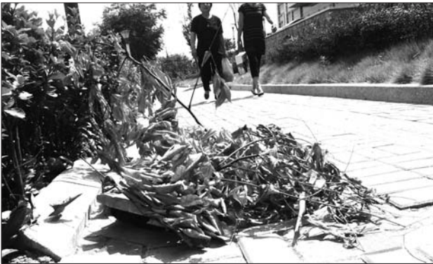
污水井盖上堆满枯枝垃圾。

“以前铁质井盖常被偷,钢筋混凝土材质的井盖使用两年后,混凝土会自动脱落,合成树脂材质的井盖正常使用年限至少30年,而且安全系数高。”李鼎泉介绍。