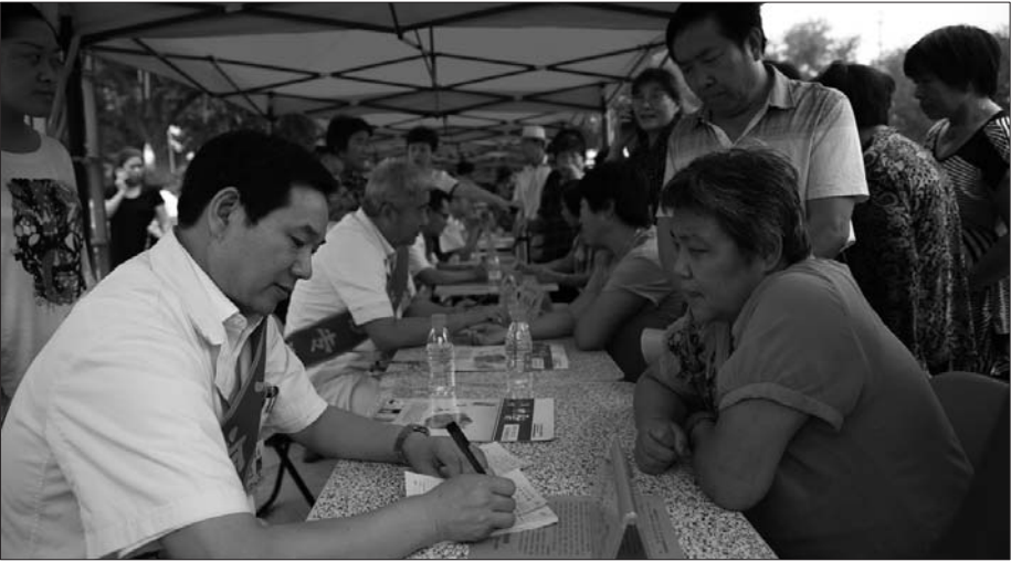
9月8日,潍坊市基层中医药服务能力提升工程、中医中药“进农村、进社区、进家庭”大型巡诊公益活动走进昌乐。潍坊市中医院派出了由学科带头人、潍坊名医为主力阵容的20名专家,联合昌乐县10余个医疗单位和县中医院20名专家,开动巡诊“大篷车”,携带B超、X光、心电图等免费查体设备来到昌乐,为百姓送去健康。

元。 此次团购,分为现场团购和大宗团购两种形式。现场团购在北海路福寿街西北角金诺大厦10楼和阳光100城市广场接待中心进行。活动现场,消费者可免费品鉴日照绿茶,品尝来自新疆喀什的香甜大枣。对大宗团购(一次购买某宗商品总价在3000元以上),读者可拨打本报热线2978003或18663676778提前预约。届时将免费送货上门,并给予特殊优惠政策。