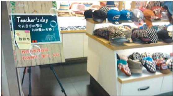
一超市打出“教师节”的宣传。

“教师节原本是个很有意义的节日,再被各种商品、卡等礼物充斥着,失去原本的意义。每个家长都劝身边的人,不要给老师送礼,人人都不送了,家长、老师都轻松了。”泰山博文中学一位老师说。